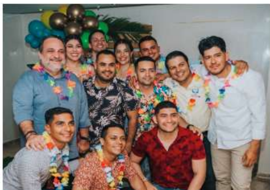
• Informe de sostenibilidad

Este indicador evidencia que Ecodiesel se consolida como una marca empleadora sólida, donde los profesionales desean permanecer y crecer.